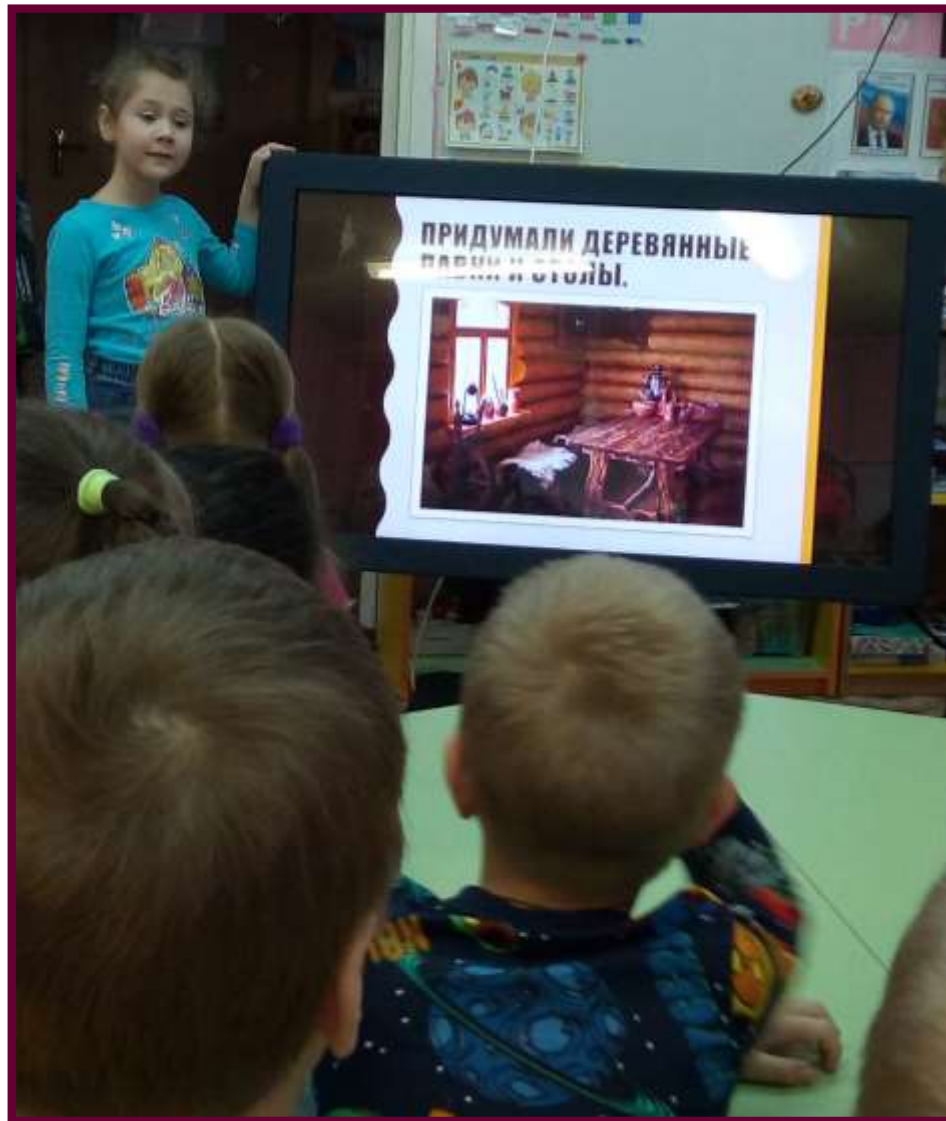
История появления мебели